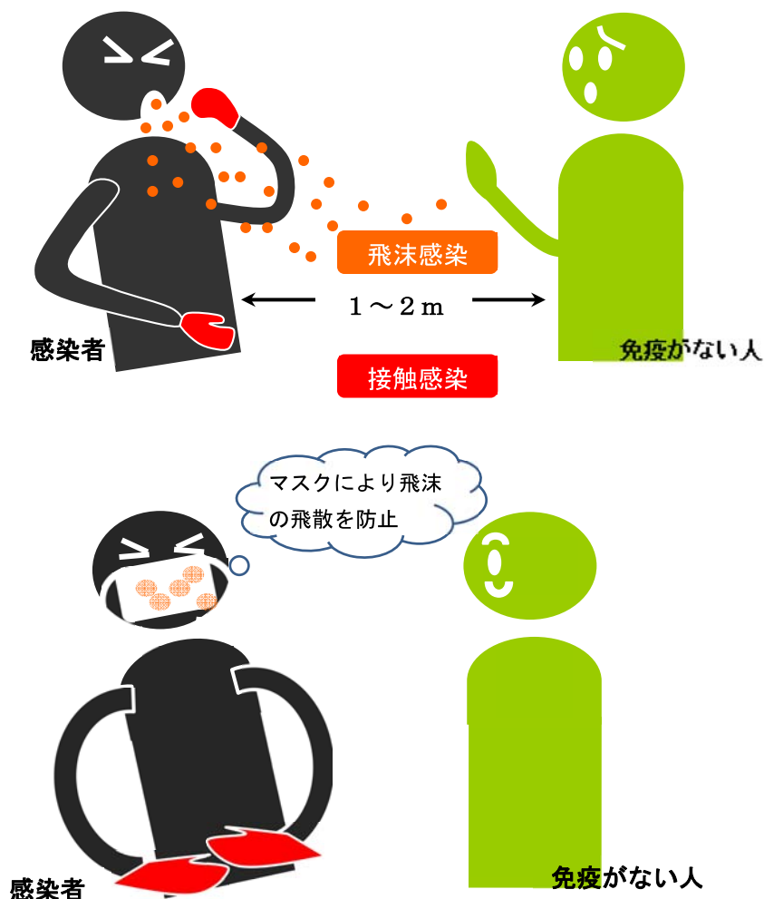
図2 新型インフルエンザの主な感染経路